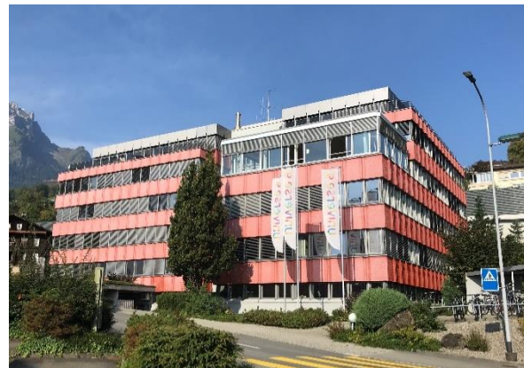
«Universe9», Hergiswil/NW www.universe9.ch